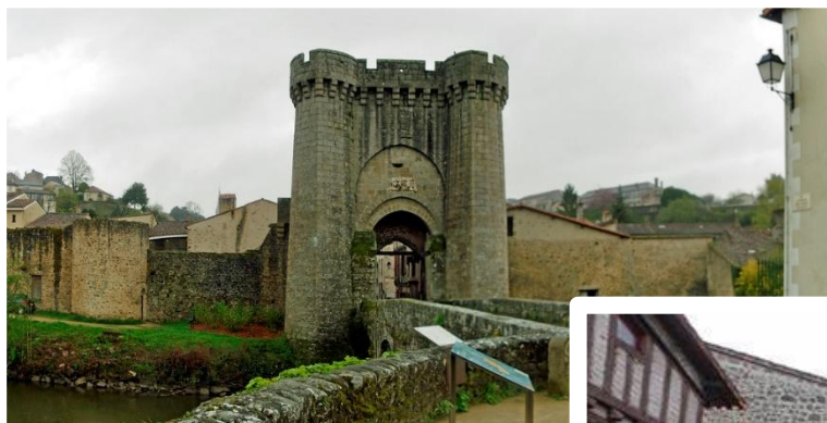
Figure 1_ La Porte Saint Jacques

La Course des Remparts se déroule en ville avec la découverte du Quartier Médiéval de Parthenay à partir de Cadets pour le 8km, de Juniors pour le 16km, de minimes pour le Relais Entreprise et sur la piste Jean Claude Guion à l'Enjeu, pour les plus jeunes.