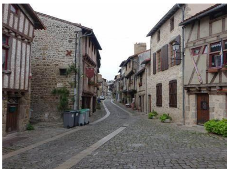
Figure 2_ La Vau Saint Jacques