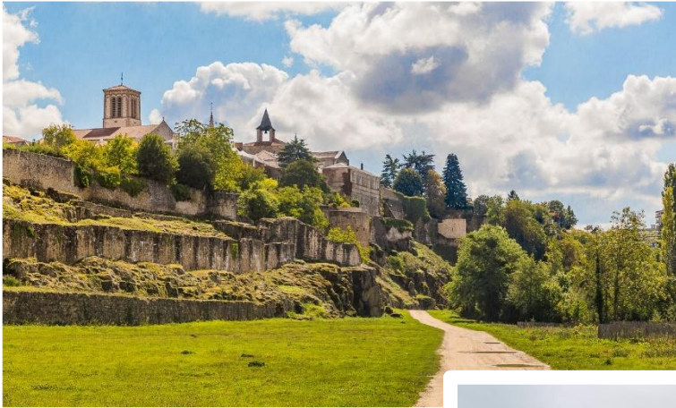
Figure 3_ La Prée