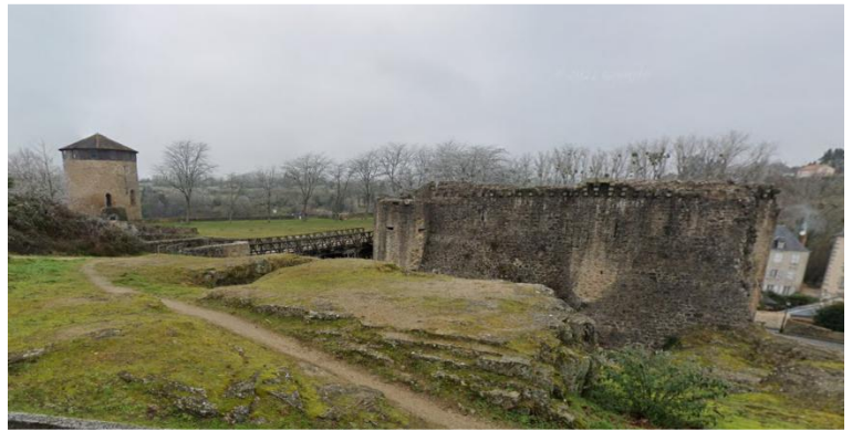
Figure 4_ La Tour de La Poudrière et le Château